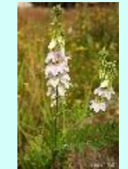
Echte Geißraute Galega officinalis