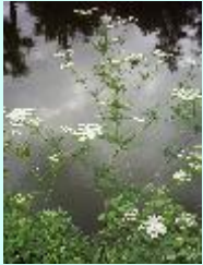
Rüben-Kälberkropf Chaerophyllum bulbosum