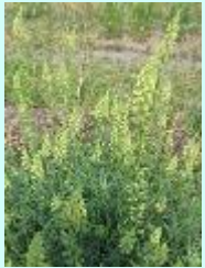
Gelbe Resede Reseda lutea

Exkursion der Botanik Ag im Kreis Steinburg in die Oberlausitz 2005