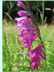
Wiesen-Siegwurz Gladiolus imbricatus