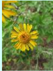
Färber-Hundskamille Anthemis tinctoria