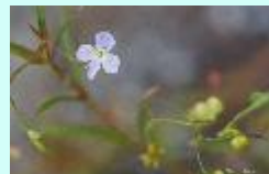
Schild-Ehrenpreis Veronica scutellata