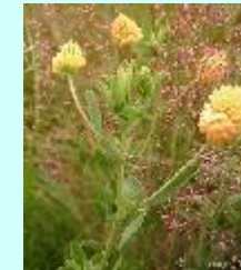
Gold-Klee Trifolium aureum