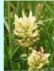
Bärenschote Astragalus glycyphyllos