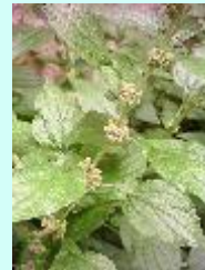
Aufrechtes Glaskraut Parietaria officinalis