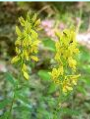
Färber-Ginster Genista tinctoria