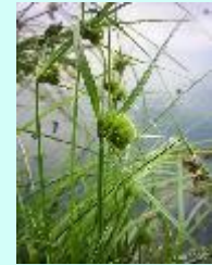
Zypergras-Segge Carex bohemica