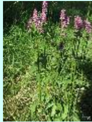
Gemeine Betonie Betonica officinalis