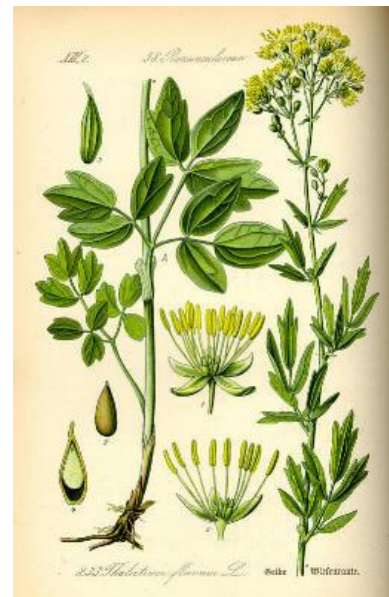
Gelbe Wiesenraute ( Thalictrum flavum )