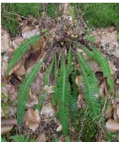
Rippenfarn ( Blechnum spicant )