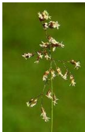
Duftendes Mariengras ( Hierochloa odorata )