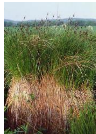
Rasen-Segge ( Carex cespitosa )