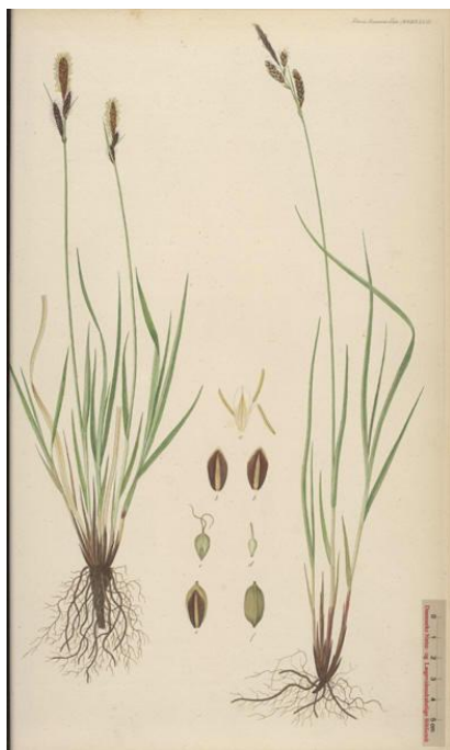
Rasen-Segge ( Carex cespitosa )